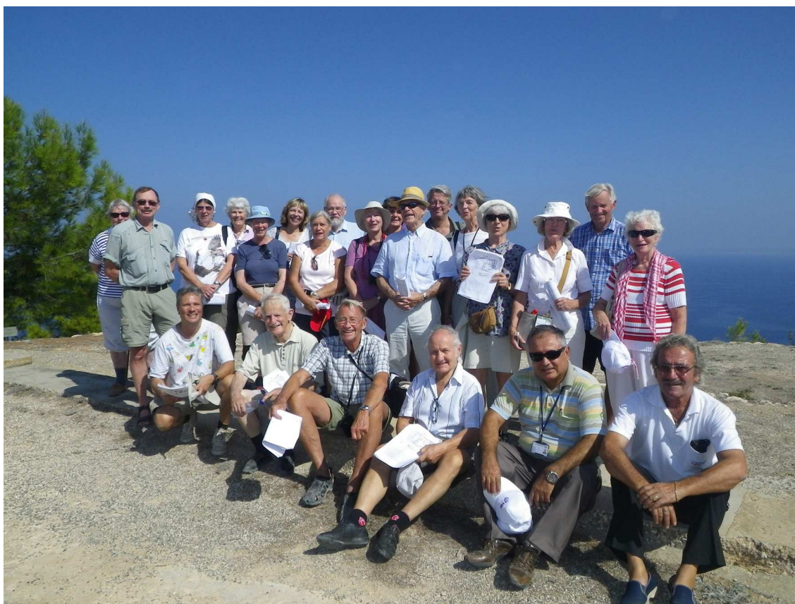
Nöjda deltagare på årets arkeologiska resa.

Moskén är den fjärde viktigaste moskén i världen, vilket många muslimer inte känner till. De tre andra viktiga är moskéerna i Mecka, Medina samt Klippmoskén i Jerusalem. Moskén Hala Sultan Tekke är en viktig pilgrimsort för muslimer. Den kallas ”Den gamla kvinnans moské”. Hit kommer från Damaskus år 649 Mohammeds faster eller amma. Hon går i land vid stranden nära nuvarande moské, ramlar av en åsna och slår ihjäl sig samt begravs på platsen inom ett dygn. Sägner berättar också att dagen efter står tre stora stenar på platsen – vilka kan ses inne i moskén vid hennes grav. Det sägs vara ett mirakel eller att änglar från Jerusalem tar hit dem.