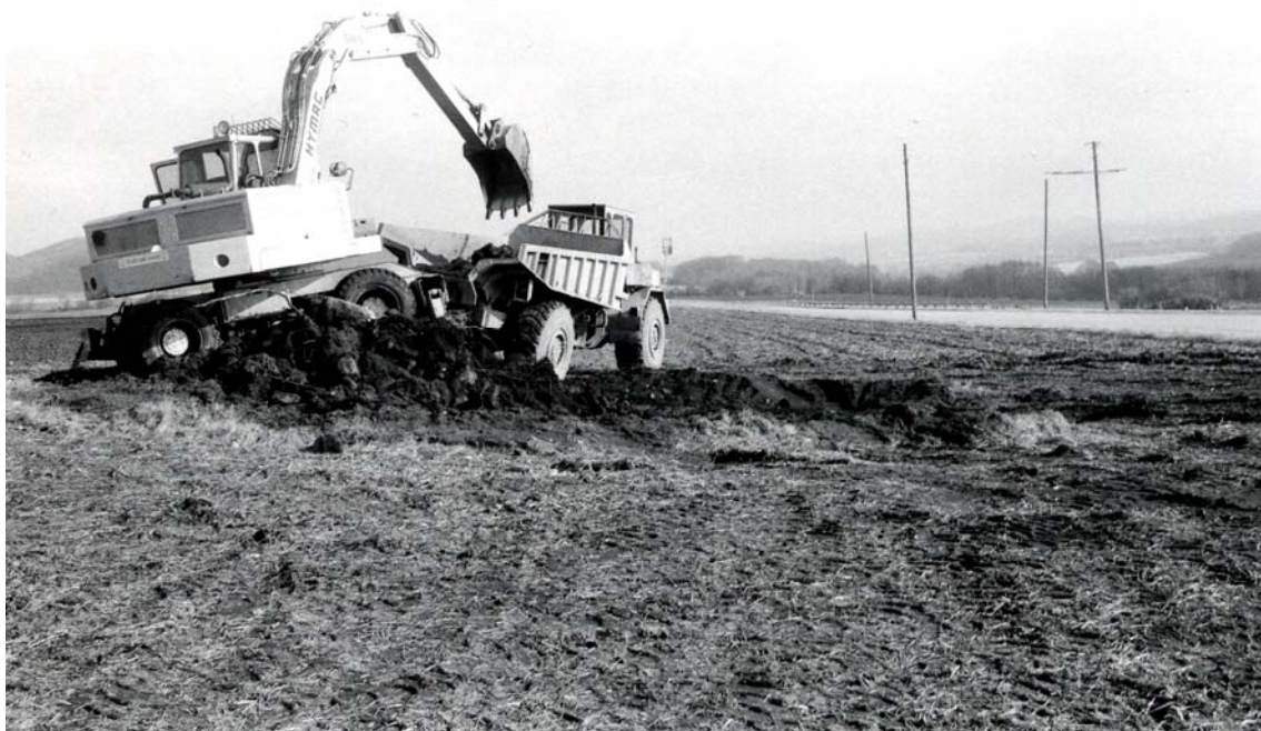
Här schaktas gravhögen bort. Strax efter att fotot togs avbröts arbetet. Foto: Lennart Lundborg, 1982.